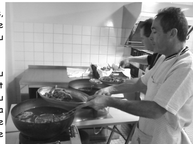
Nos Super-Cuisto's en pleine action

Malgré un début un peu timide, les danseurs sont vite apparus et ont pu s'amuser en attendant la friture qui a su se faire désirer pour n'être que plus appréciée.